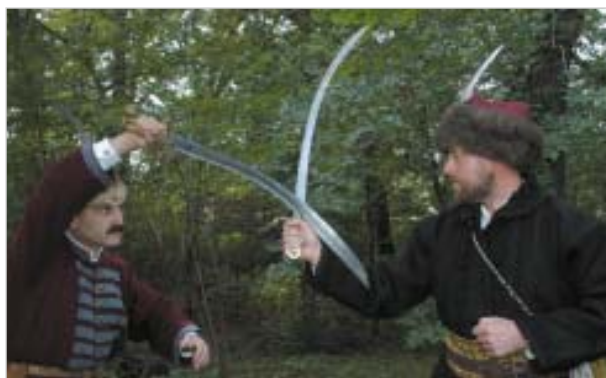
A fokél használata: ráfordítás után az ellenfél csuklóját hasítja

A fokél a penge homorú felének a hegy felőli éles része. Kialakítása a honfoglaló magyaroknál terjedt el, mely egészen a XX. századig a magyar és sztyepei szablyák egyik jellegzetesége lett. A különböző történelmi korszakokban a fokél hossza, szélessége változott, de rendeltetése nem. A penge domború, éles felével hosszasan lehetett hasítani vagy vágni. A fokéllal visszahúzáskor a penge ráfordításával az ellenfél csuklóját, a fegyvert markoló ujjait lehetett elvágni, amit a pengével ellentétesen hajló markolat jelentősen elősegíthetett. A fokél növelte a szúrás hatékonyságát is, mivel az egyszerre domború és homorú penge a sebet mindkét irányban nagymértékben kiszélesíthette. A fokél használata amiatt is hatékony volt, hogy a harc során mindig éles maradt, mert soha nem hártottak a penge homorú felével, azaz a fokéllal.