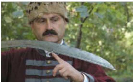
A szablya fokéle (A penge homorú felének éles része)

A szablya valószínűleg a VII–VIII. század fordulóján alakult ki a kelet-európai, kaukázusi és délnyugat-szibériai térségben. Létrejötté köthető a griffes-indás, vagy más néven az onogur avarok vándorlásához is (így némiképpen a Kárpát-medence is szóba jöhet mint kialakulási terület). Bizonyos, hogy a szablyát először a kengyelvasat és oldal szárnyas, kápás nyeretet ismerő sztyepei népcsoportok használták. Az avarok és a honfoglaló magyarok szablyája enyhén ívelt, inkább keskeny pengéjű fegyver, de a többi sajátossága eltérő.