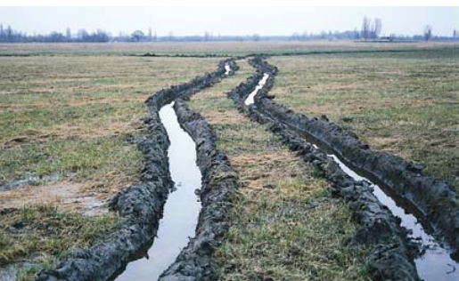
Keréknyom a szikes legelőn