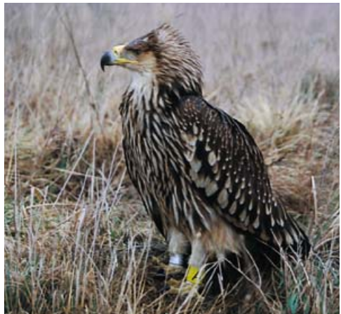
Fiatal parlagi sas

A falutól keletre, a Tápió két partján elhelyezkedő szikes legelő, mely a megyehatáron túlnyúlva egészen Újszász határáig húzódik. Védett növényei közé tartozik a halványlila szirmú fátyolos nőszirm (Iris spuria) és a bennszülött, csak a Kárpát-medencében előforduló kisfészkes aszat (Cirsium brachycephalum) . Tavasszal a gyep nagy részét sekély tocsogók borítják, ahol ritka madárfajok sokasága fészkel. Ezek közé tartozik a fokozottan védett piroslábú cankó (Tringa totanus) , és a terepszíneben rejtőzködő sárszalonka (Gallinago gallinago) . Az egykori tanyahelyek akácsoportjainak koronájában kékvércsék (Falco vespertinus) nevelik fiókáikat. Nyár végétől kóborlásaik során gyakran keresik fel a ragadozó madarak a Gulya-gyepet, köztük olyan ritka fajok is, mint a parlagi sas (Aquila heliaca) , a kígyász-ölyv (Circaetus gallicus) és a pusztai ölyv (Buteo rufinus) . A területet néhány éve megvásárolta a Duna-Ípoly Nemzeti Park Igazgatóság, amely június és szeptember között itt legetteti több, mint 100 állatot számláló szürkemarha-gulyáját.