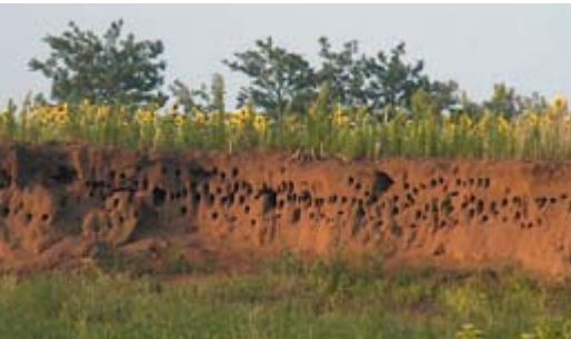
Költőüregek a homokfalban

A Tápió-vidék középső részét borító homokhátság végső, néhány hektáros része a szelei határból átnyúlik Tápiógyörgye területére is. Az itt található felhagyott homokbányában nyáron hangos madárzsivaly fogadja a látogatót. A meredek homokfalba vájt, akár a két méter hosszúságot is elérő üregekben hazánk legszínesebb madarai, a gyurgyalagok ( Merops apiaster ) és legkisebb fecskéi, a partifecskekék ( Riparia riparia ) költenek. Mindkét faj elsősorban repülő rovarokra vadászik. Míg a gyurgyalag egy-egy kinyúló ágon ülve lesi zsákmányát, addig az örökmozgó partifecske szinte egész napját a levegőben tölti. A gyurgyalagok már korán, augusztusban elindulnak afrikai telelőhelyeik felé, vonuló csapatainak pirregő hangját ilyenkor a települések felett is sokszor hallhatjuk.