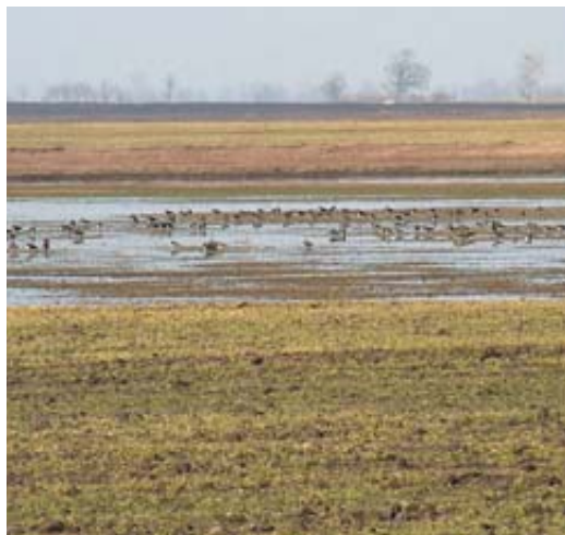
A Nagy-szék, parti madarakkal

A 19. század derekán Tápiógyörgye határában még félszáznál több székeknek nevezett szikes tavat írtak le, melyekből napjainkra mindössze nyolc maradt. Ilyen a falutól északra elhelyezkedő Vámos-szék, az Újszilvás felé eső Nagy-szék és a Görbe-szék. Az utóbbi évek aszályos időjárása, illetve a mesterséges csatornák túlzott vízelvezetése miatt ma már csak a csapadékosabb években telnek meg vízzel, emiatt az egykor fehér medrű, vakszikes tómedreket benőtte a növényzet. Kedvező vízállapotok esetén azonban néhány hétre csodálatos madárvilág telepszik meg rajtuk. Olyan ritkaságok költése bizonyosodott be itt, mint a fokozottan védett gólyatöcs ( Himantopus himantopus ), vagy a Tápió-vidéken először fészkelő feketenyakú vöcsök ( Podiceps nigricollis ). A magyarországi szikes tavak jelentőségét mutatja, hogy az 1997-ben életbe lépett természetvédelmi törvény országos jelentőségű természetvédelmi területté nyilvánította őket, csakúgy, mint valamennyi forrást és lápot.