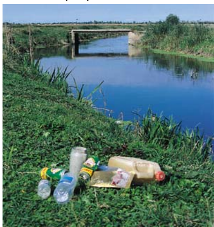
Szemét a Tápió-parton

A vadon élő növény- és állatfajokra, valamint élőhelyeikre számos veszély leselkedik. Ezek döntő része valamilyen módon az emberi tevékenységekhez köthető. A szántók által körbevetett gyepek széleiből szinte minden évben elszántanak egy-egy darabot, holott a rossz minőségű szikes talajon alig teremnek meg a haszonnövények. Márciusban, sőt még áprilisban is nagy területeket égetnek le, mely során a tavaszi napsugarak hatására előbújó gerinctelen állatok tömegesen pusztulnak el. Sok gyepterületen használnak még ma is műtrágyát, mely az egyszikű füvek elburjánzását okozza. Ennek eredményeként pedig a kétszikű növényfajok, a vadvirágok, és a velük táplálkozó állatfajok is rövidesen kipusztulnak. Sokszor előfordul, hogy terepjárókkal, traktorokkal bemerészkednek a felázott szikes gyepekre mély keréknyomokat hátrahagyva, melyek a roppant sérülékeny talajon csak hosszú évtizedek múlva tűnnek el. A nagy számú mesterséges csatorna gyorsan elvezeti a szikes vízállásokat, tavak vizét, így a vízhez kötődő fajok már nem találják meg életfeltételeiket.