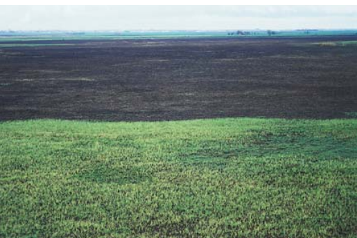
Leégetett szikes legelő