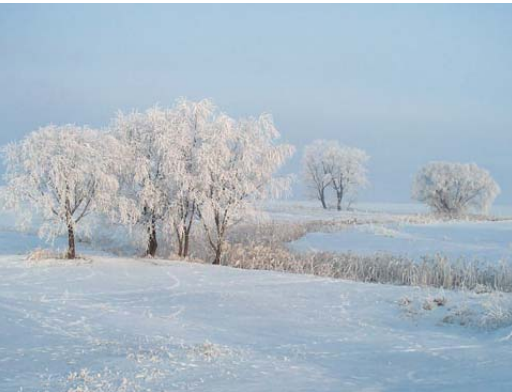
Fűzfák az Ilike partján télen...