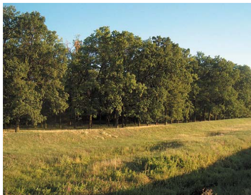
A Kiserdő tölgyfái

A falu szélén, a vasút vonal két oldalán elhelyezkedő néhány hektáros telepített erdőcske két okból is különleges. Egyrészt, mert fő tömegét a vidékünkön egyre kevesebb helyen látható kocsányos tölgy (Quercus robur) alkotja, mely egykoron az Alföld leggyakoribb fafaja volt. Sajnos, az egykori tölgyesek élőhelyeit a tájidegen fenyő-, akác- és nemesnyárültetvények ma már szinte teljesen elfoglalták. Másrészt pedig itt található a Tápió mente egyetlen fészkelő vetési varjú (Corvus frugilegus) kolóniája. A téli időszakban, hatalmas csapatokban Magyarországon időző vetési varjak főleg Ukrajnából és Oroszországból érkeznek hozzánk. Azonban a hazánkban költő varjak száma ennek csupán töredéke. Mivel állománya az elmúlt években erősen lecsökkent, 2001-ben védetté nyilvánították.